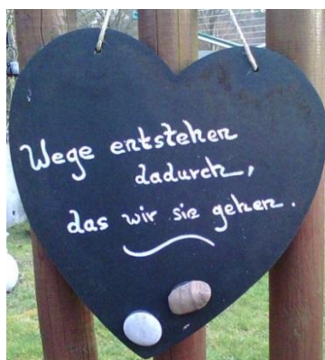
Schild am Bornweg

Impressum: Redaktion: Martha Schiendzielorz, Heidrun Schönert, Kerstin Nöller, Conny Schmidt, Ilse Berghäuser, Karen Pehl, Heide Nierste, Karl Randa und Alexander Taitl. V.i.S.d.P. / Herausgeber: Arbeitskreis Kultur, Alexander Taitl Tel.: 508428. Artikel, Leserbriefe und Fotos an: blaettsche@swa-fischbach.de. Fischbacher Homepage: www.swa-fischbach.de Leserbriefe (ggf. gekürzt) geben nur die Meinung des Verfassers wieder u. müssen nicht der Meinung des Blättsche entsprechen.