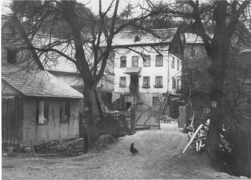
Aus dem alten Fischbach