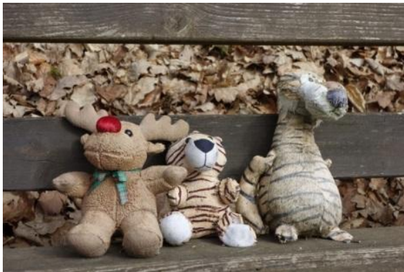
Auf der Bank am Kirchweg