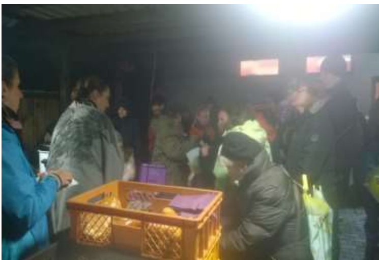
Die Weckmänner und...