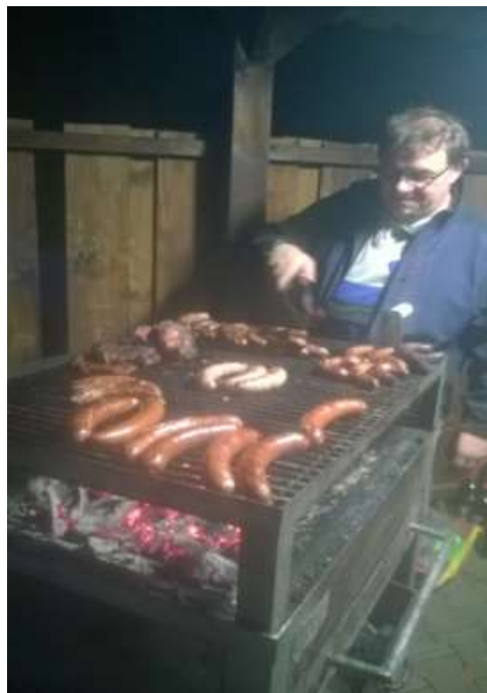
...die Brotworscht, die Steaks und der Grillmeister